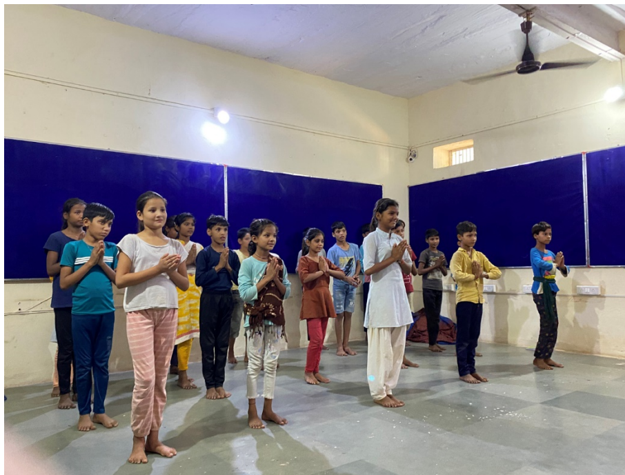
Die Schüler*innen üben schon seit Wochen eifrig für die Singla 10-Jahres-Feier

Alles, was wir in 2023 erreicht haben, war nur möglich dank Ihrer Spenden, Geldspenden und Zeitspenden.