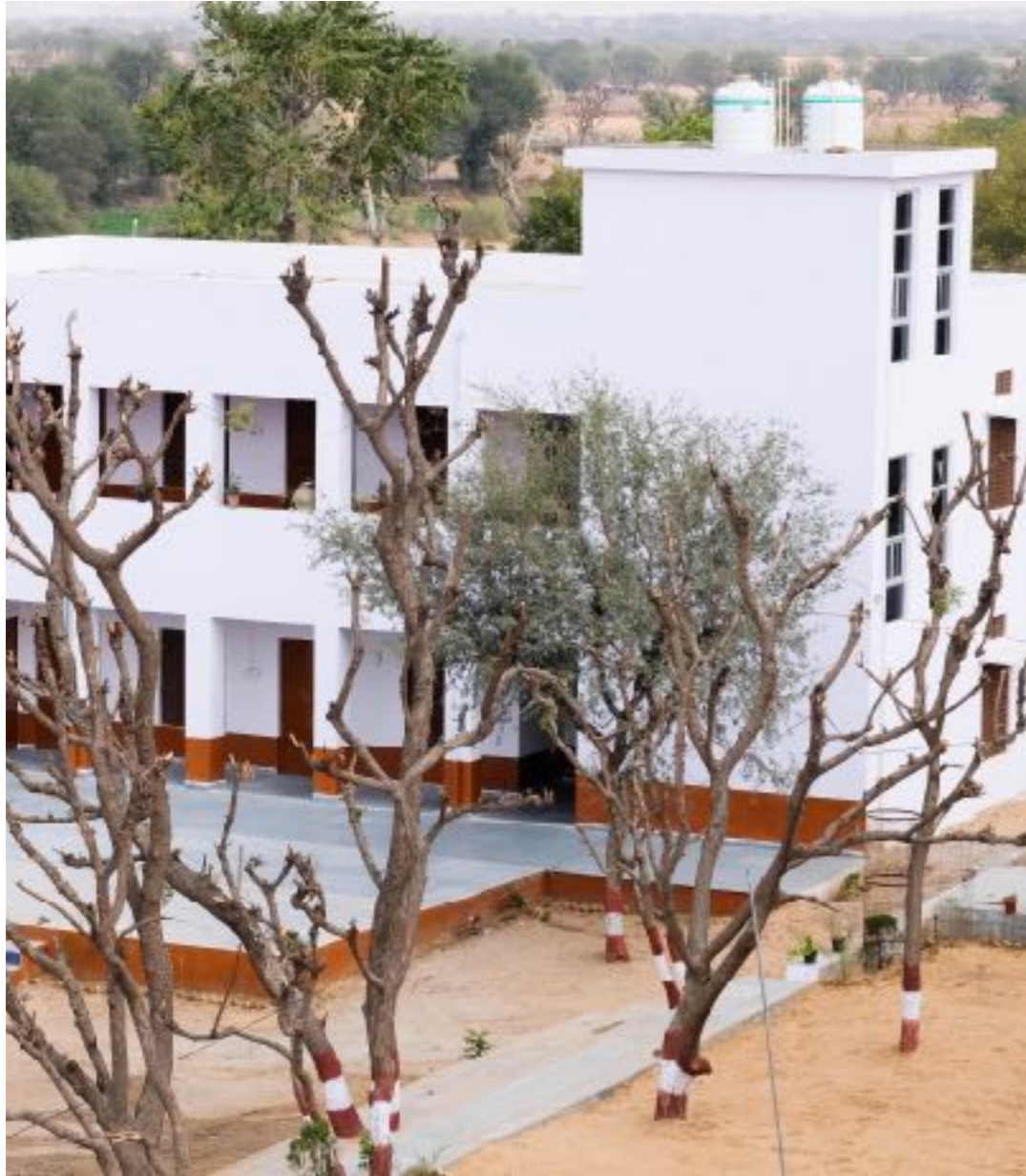
Haus der Mädchen